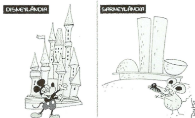
Charge 1: Disponível em http://th6.ggpht.com/_MjjsUY1J8po/Si6_9ZVmPoI/AAAAAAAAACA/Ea_EDTShuNg/image015.jpg . Acesso em 27 de agosto de 2009.