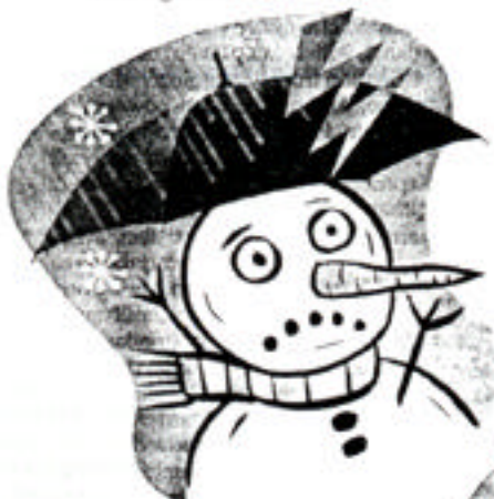
FOUL WEATHER Researchers have found that exposure to frigid temperatures can trigger heart attacks as well as angina and strokes