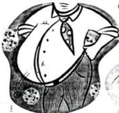
BODY SHAPE Being overweight is bad enough, but if your fat lies more in the abdomen than the hips, you are especially prone to heart disease