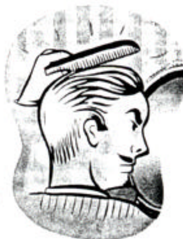
BALDNESS A shiny spot on top of the head has been linked to a risk of heart attack three times higher than average

H EART ATTACKS HAVE BEEN linked not only to diet, smoking and obesity but also to less obvious risk factors—many of which we have no control over. Among the oddest: