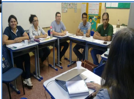
Fonte: orientação nas Escolas