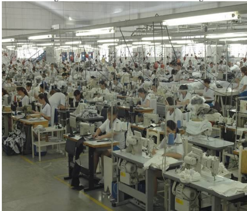
Imagem III – Trabalhadores da Indústria Krindges