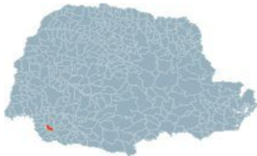
Imagem I – Localização de Ampére no Estado do Paraná

A imagem I, apresentada a seguir, ressalta a localização da cidade de Ampére no Estado do Paraná. Mesmo Ampére possuindo apenas 17.308 habitantes, conforme dados do IBGE (2010), considero sua participação no mercado de vestuário significativa para compor essa pesquisa, seja pelo destaque que ganha no meio empresarial e pelo apelo midiático, seja pelas práticas dos trabalhadores que na sociedade capitalista atual.