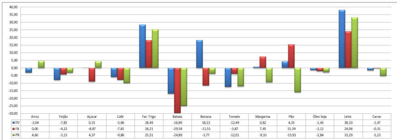
Gráfico 03 – Variação Acumulada (%) - Dois Vizinhos, Francisco Beltrão e Pato Branco jan-ago/2018.