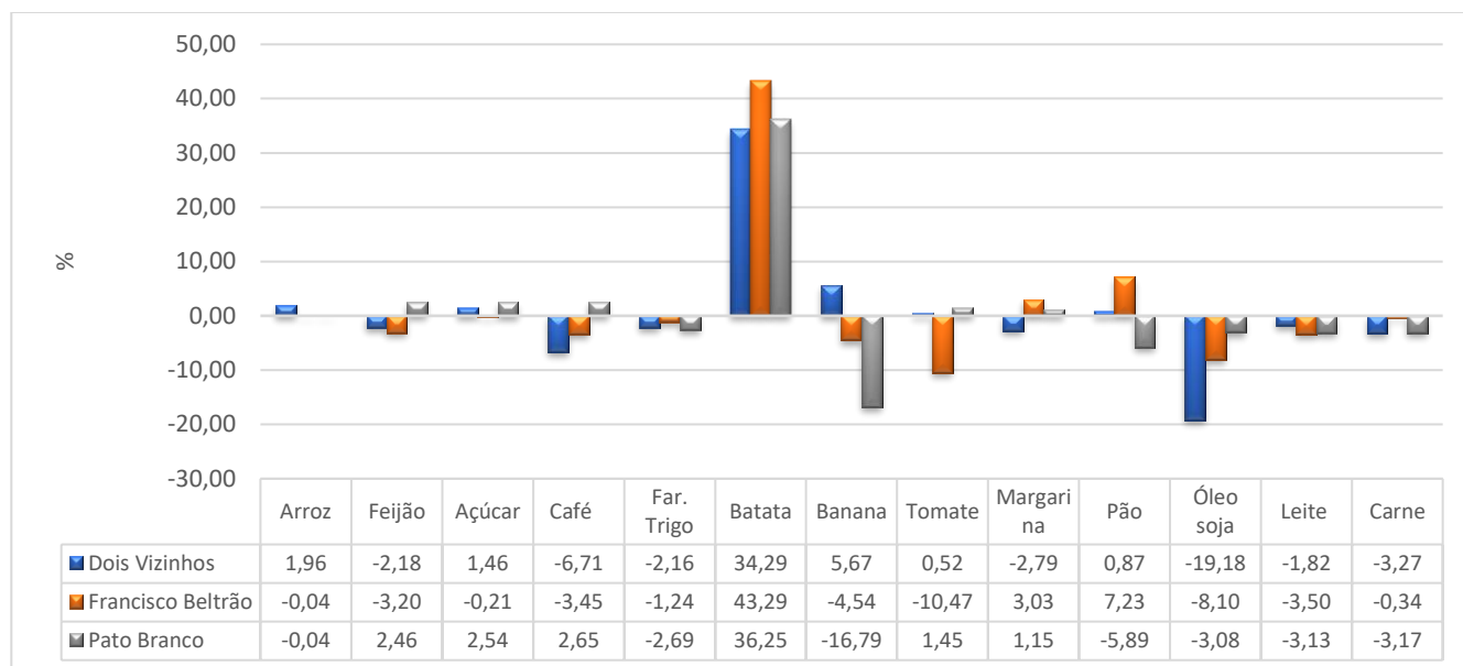
Gráfico 01 - Variação % mensal dos preços dos itens da Cesta Básica - Dois Vizinhos, Francisco Beltrão e Pato Branco – junho/2023. Fonte: Base de Dados Equipe Pesquisadora (GPEAD/UNIOESTE e Colaboradores).

básica referentes a junho de 2023 podem ser observados nos gráficos 01 e 02, na sequência.