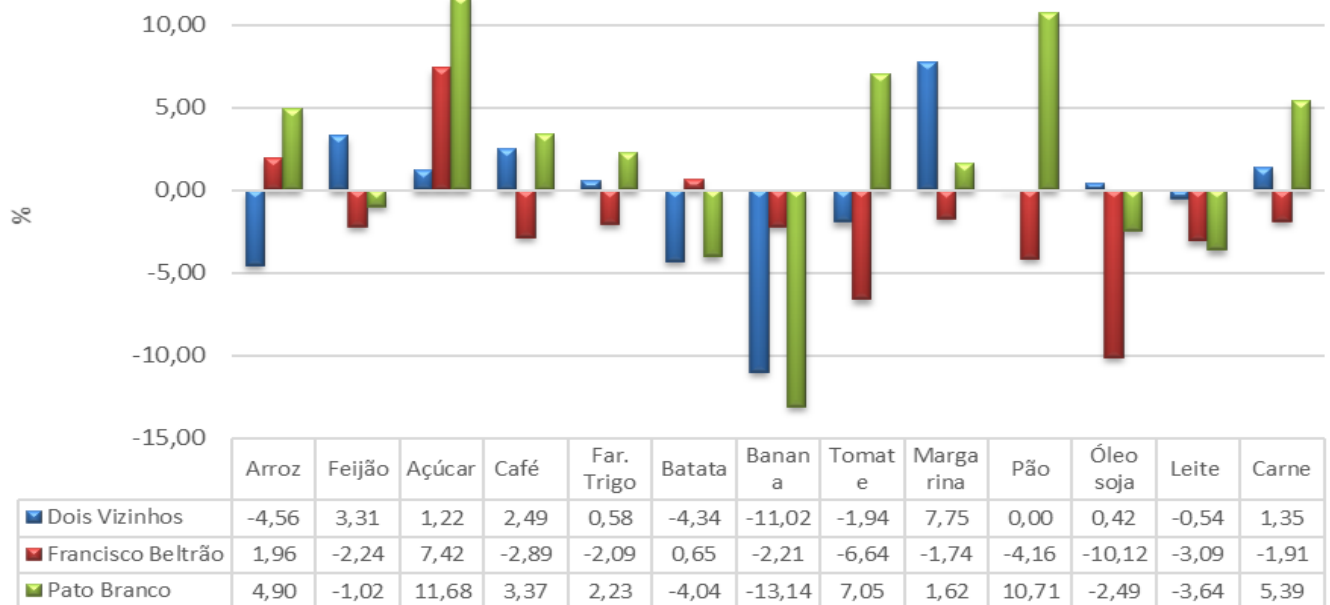
Gráfico 01 - Variação % mensal dos preços dos itens da Cesta Básica - Dois Vizinhos, Francisco Beltrão e Pato Branco – maio/2023.