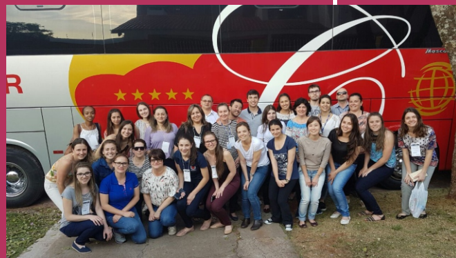
Foto 6: Professores e alunos da Unioeste, Campus de Francisco Beltrão.